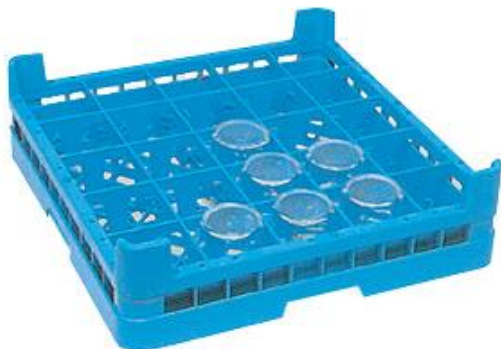
Lavado de vajilla - Accesorios para lavavajillas - Cestas de lavado - - para vasos o copas